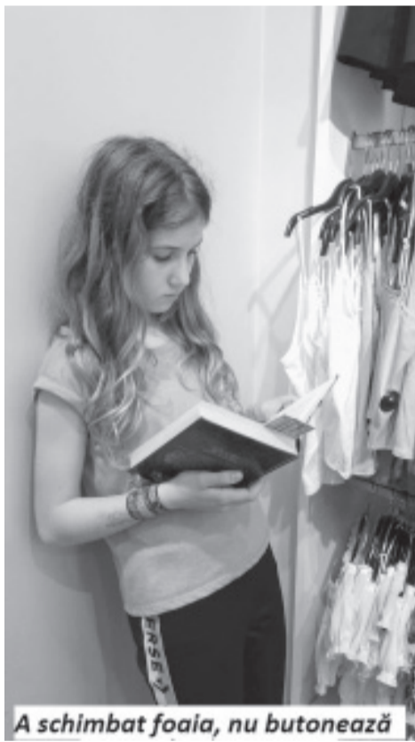
A schimbat foaia, nu butonează

Mă tulbur când grădina mă caută în vis Cu magice miresme în lațul ei m-a prins.